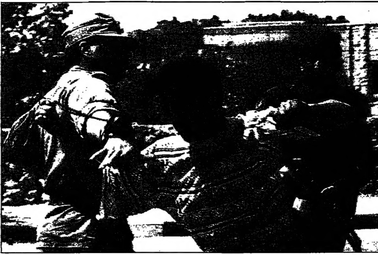
شخص فلسطيني يمنع شابا كان يحاول رشق حجارة على جنود اسرائيليين أثناء اشتباكات عند حدود مدينة بيت لحم